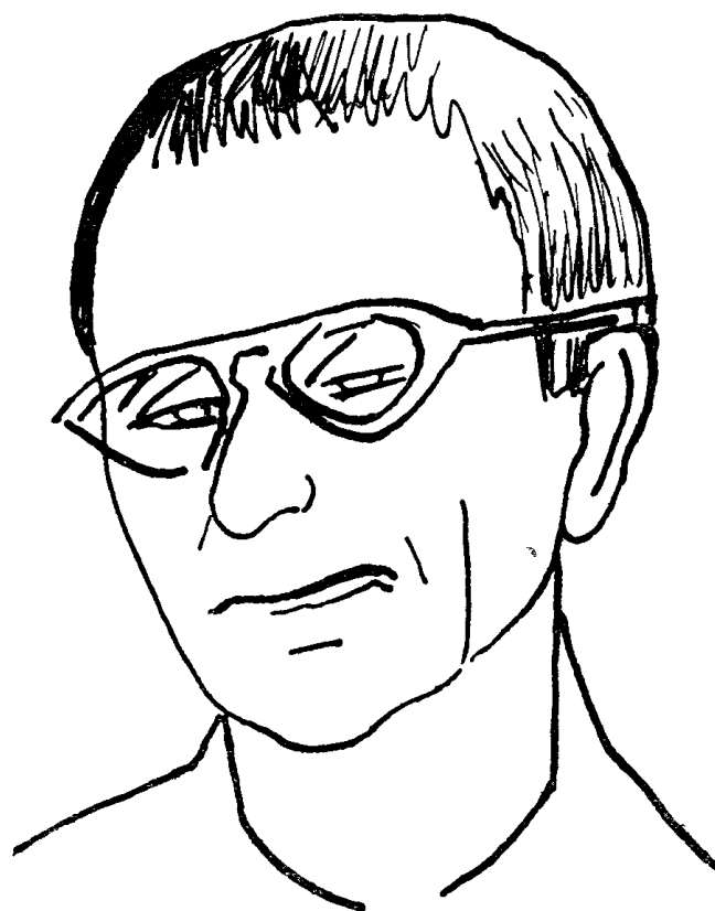
BERTOLT BRECHT