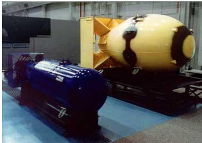
Little Boy y Fat Man